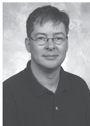
Рис. 2.2. Андерс Хейлсберг

Версия Delphi 6 (2000 год) отличалась развитой поддержкой веб-сервисов. Был реализован набор «тонких» компонентов dbExpress для быстрого доступа к СУБД. Наряду с Delphi 6 корпорация Borland выпустила новый пакет Kylix, ориентированный на создание программ на языке Delphi для платформы Linux. В результате линейка продуктов Delphi стала кросс-платформной. Один и тот же исходный код приложения на языке Delphi мог компилироваться и в среде Delphi, и в среде Kylix для разных операционных систем.